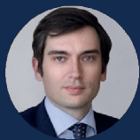
КОЛЕСНИКОВ МАКСИМ АНДРЕЕВИЧ

Первый заместитель министра экономического развития РФ