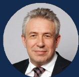
ГОРЬКОВ СЕРГЕЙ НИКОЛАЕВИЧ

Депутат Государственной Думы ФС РФ, к.ф.н.