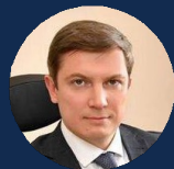
МАТЮШИН КИРИЛЛ РУСЛАНОВИЧ

Генеральный директор ПАО «ЦМТ» экс-вице-президент ТПП РФ, экс-заместитель министра экономического развития и торговли РФ