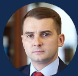
НИЛОВ ЯРОСЛАВ ЕВГЕНЬЕВИЧ

Депутат Государственной Думы ФС РФ, первый заместитель председателя Комитета Государственной Думы по охране здоровья, заслуженный врач РФ, д.м.н, профессор