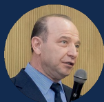
КВИНТ ВЛАДИМИР ЛЬВОВИЧ

Академик РАН, д.э.н., Лауреат высшей награды МГУ, член Президиума Международного Союза экономистов