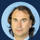
ЛИСОВСКИЙ СЕРГЕЙ ФЁДОРОВИЧ

Депутат Государственной Думы ФС РФ, к.п.н., Член Комитета Государственной Думы по безопасности и противодействию коррупции