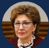
КАРЕЛОВА ГАЛИНА НИКОЛАЕВНА

Первый заместитель министра экономического развития РФ