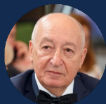
РЕНОВ ЭДУАРД НИКОЛАЕВИЧ

Депутат Государственной Думы ФС РФ, Заместитель Председателя Комитета Государственной Думы по науке и высшему образованию