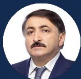
ГАСАНОВ ДЖАМАЛАДИН НАБИЕВИЧ

Депутат Государственной Думы ФС РФ, Председатель комитета Государственной Думы ФС РФ по труду, социальной политике и делам ветеранов